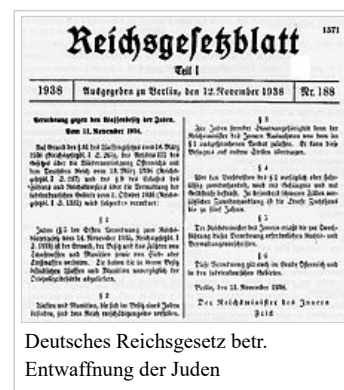
Deutsches Reichsgesetz betr. Entwaffnung der Juden

1970 wurde auf Initiative des Hamburger Senats eine Bundesrats-Kommission unter dem Vorsitz des Hamburger Regierungsdirektor Siegfried Schiller gegründet, die den Entwurf für das bundeseinheitliche Waffengesetz erarbeitete. Sein Bestreben war, „möglichst allen Bürgern in allen Regionen zu verwehren, sich zu bewehren.“ Der Hamburger Regierungsdirektor beharrte darauf, „daß schon der bloße Waffenbesitz ganz ohne Hintergedanken zu einer Gefahr für die Allgemeinheit werden könne und mithin die geplante rigorose Reglementierung vertretbar sei.“ [26] Obwohl Delikte mit Einzellade- und halbautomatischen Langwaffen, die hauptsächlich von Jägern und Sportschützen benutzt werden, nicht bekannt waren, das Bundeskriminalamt keine Statistik über deliktrelevante Schusswaffen führte und das Wirtschaftsministerium bezweifelte, ob durch eine rigorose